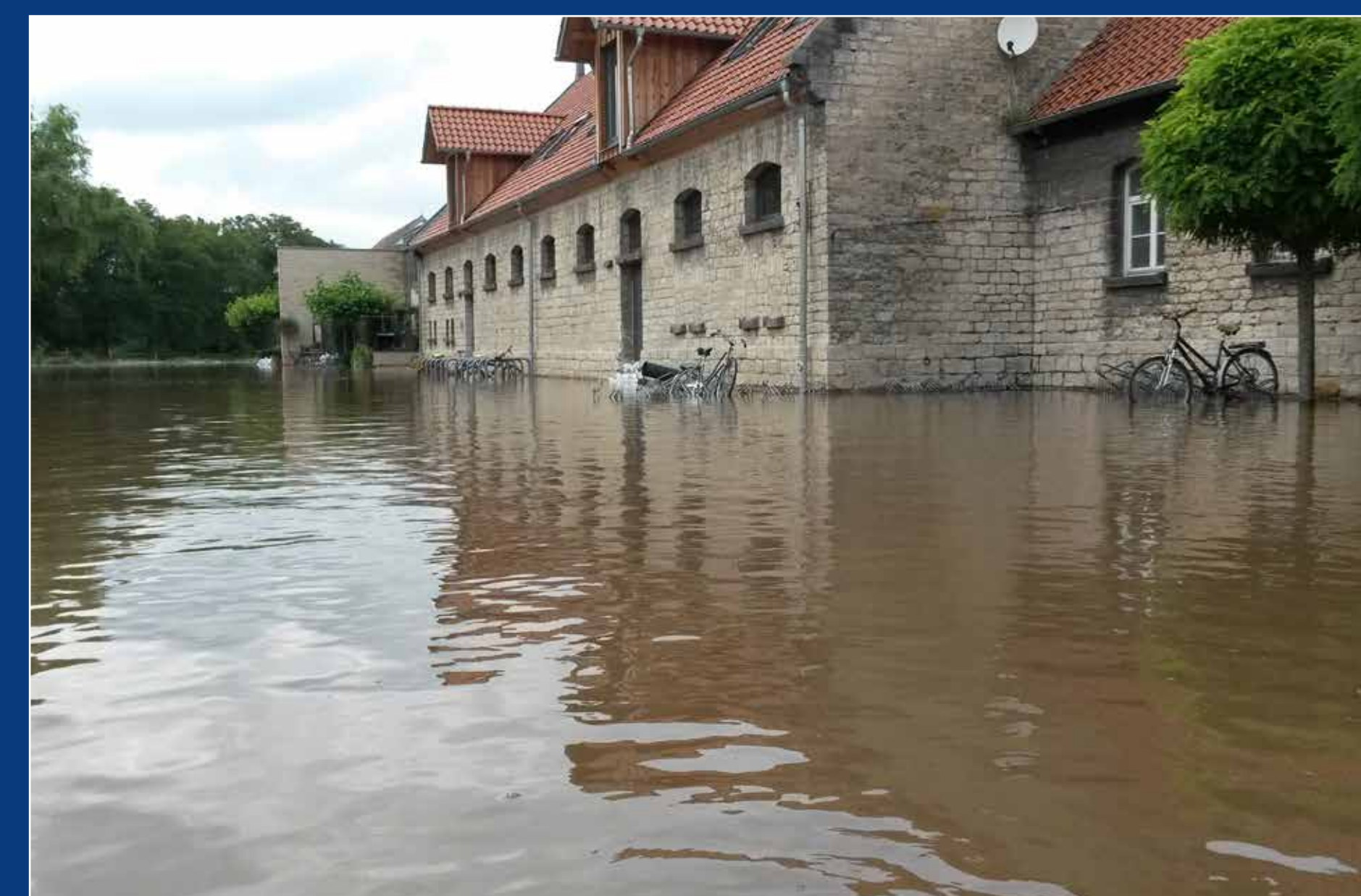
Das Wasser stand zwei bis zwanzig Zentimeter hoch in den Erdgeschossen der verschiedenen Gebäude. Nur das alte Pächterhaus, das „Weiße Haus“ und das Hofcafé kamen glimpflich davon.

Für das kommende Studienjahr möchte die Stiftung Universität Hildesheim nun das ihr zustehende Kontingent für den Bundeszuschuss voll ausschöpfen. Für bis zu 1,5 Prozent der Studierenden wird dieser Zuschuss gewährt. 111 Stipendien sollen es in diesem Jahr werden. Die Kampagne „Bildung stiften 111“ setzt darauf, Bildungstifterinnen und Bildungstifter sowie der Stipendiatinnen und Stipendiaten des Deutschlandstipendienprogramms durch gemeinsame Erlebnisse zusammenzubringen.