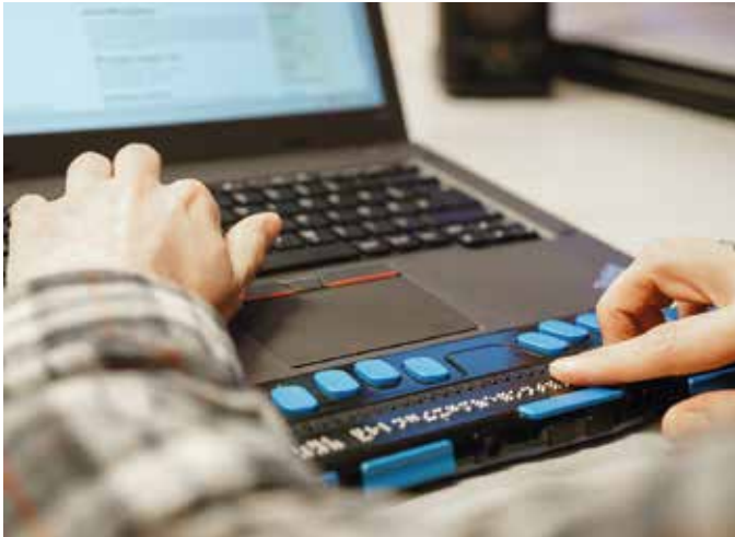
PC mit Screenreader-Software und Braillezeile.

auditive Unterstützung, indem er den Studierenden entsprechend aufbereitete Inhalte vorliest. Eine visuelle Hilfestellung bieten darüber hinaus Softwareangebote, die Inhalte vergrößert darstellen. Auch mobile Endgeräte (Smartphone, Tablet, Brailnotenizgerät) verfügen mittlerweile über intuitive Bedienhilfen, die blinden Studierenden eine eigenständige Nutzung erleichtern.