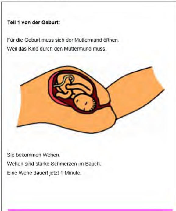
Abb. 3: Wilkes (2015: 78) Ratgeber zur Orientierung für gehörlose Schwangere vor der Geburt