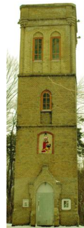
Gelber Turm (Sternwarte)