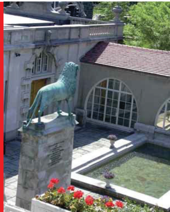
Foto: Die Kopie des Braunschweiger Löwen im Innenhof des CES

Das »diversity management« unterscheidet sich sehr positiv von der gängigen Praxis an den meisten deutschen Schulen. In Cambridge fahren auch weiterhin gelbe Schulbusse Gruppen von Grundschulkindern von einem Stadtteil in die Schule eines anderen Stadtteils, um der Ghettobildung und Segregation von »armen« und »reichen« Stadtteilen mit entsprechender ethnischer Zusammensetzung der Schülerschaften entgegenzuwirken. Nicht nur die gelben Schulbusse prägen das Straßenbild – immer wieder auch obdachlose Menschen, auch in den reichen Städten der Ostküste wie Cambridge oder Boston. Noch ein Thema für den internationalen Sozialpolitikvergleich, das hier nicht weiter vertieft werden kann – es war ein sehr spannendes, anregendes und wissenschaftlich ertragreiches Forschungssemester.♦